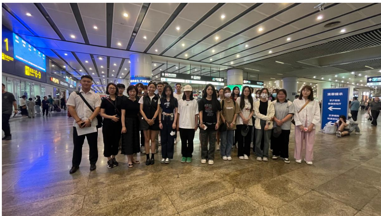
上图为双元班送岗