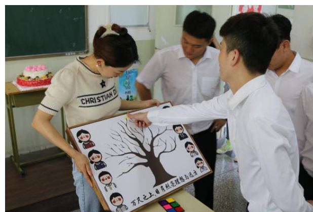
上图为双元班开班仪式