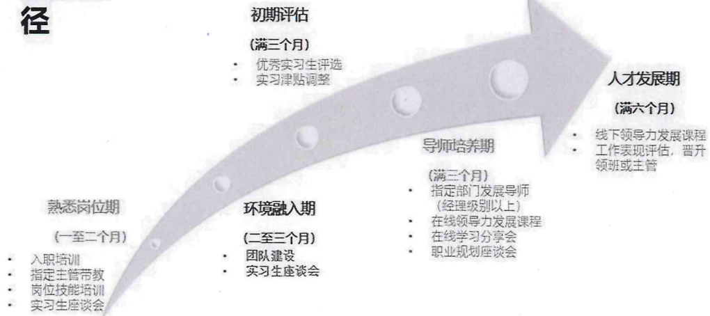
学生的发展路径规划