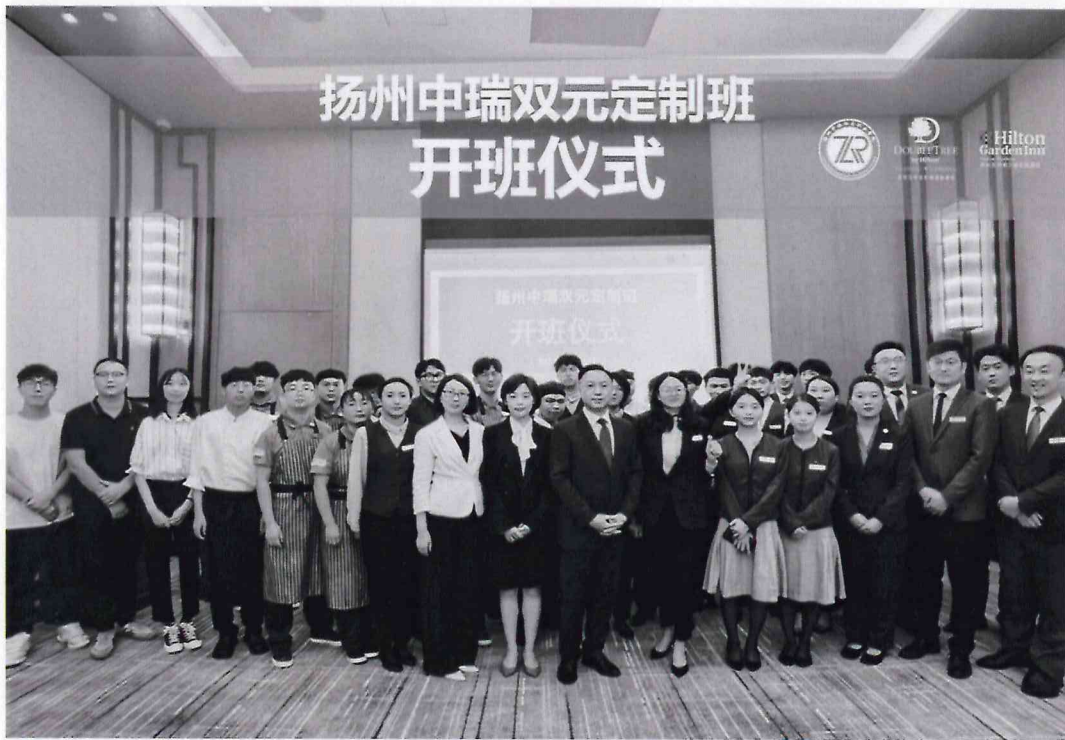
双元定制班“1+1+1”项目开班典礼